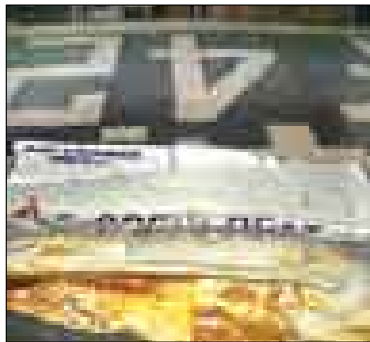
مقامات برزیل بعدها گفتند که این لاشه ۴۴۷ نیست