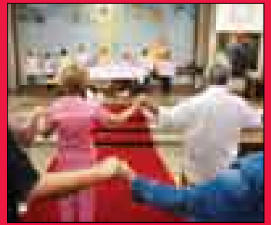
برزیلی‌ها برای کشتگان حادثه دعای خوانند