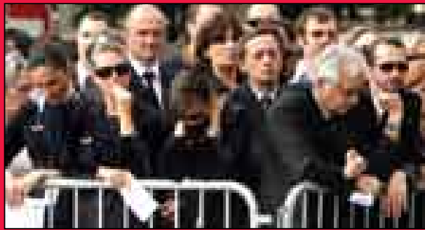
فرانسوی‌های نگران روبروی وزارت امور خارجه کشورشان