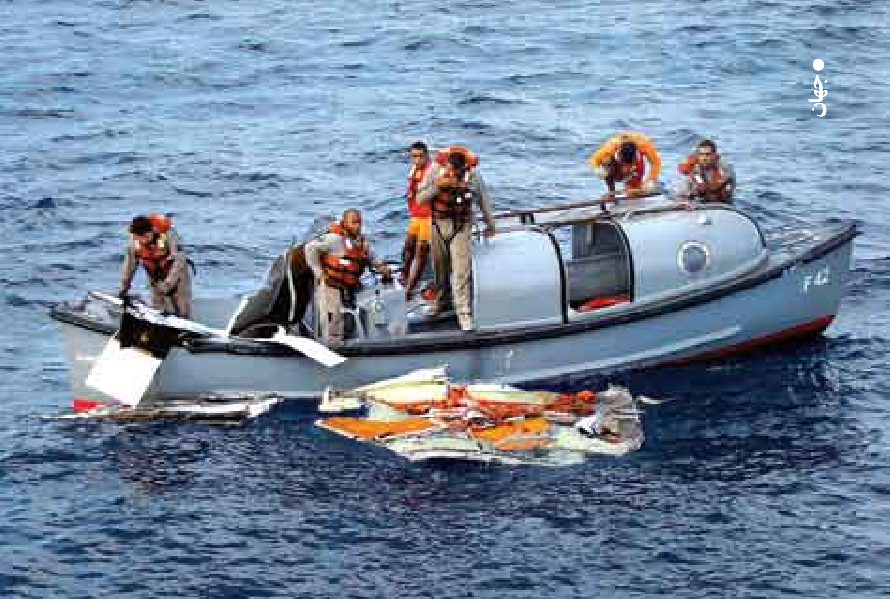
جست‌وجوی گارد ساحلی برزیل برای پیدا کردن لاشه هواپیمای ۴۴۷

با اینکه سقوط هواپیمای فرانسوی در هفته گذشته بسیار پایین‌تر از منطقه جغرافیایی مثلث برمودا اتفاق افتاد اما یادآور همان اخبار عجیب و غریب بود