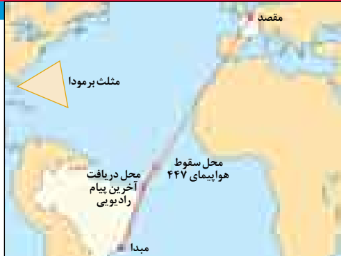
با اینکه محل سقوط، از مثلث برمودا حسابی فاصله داشت اما شبیه حوادث آن مثلث بود

بیشترین حوادث و سوانح در حوالی ضلع جنوبی آن بین باهاما و فلوریدا اتفاق افتاده‌اند. صفحات مربوط به مثلث برمودا در اینترنت بسیار زیاد و جامعدند. این مطالب، بخشی از همان حرف و حدیث‌هایی است که در دهه ۶۰ در همین ایران خودمان هم طرفدار داشت. امروزه مشخص شده که از لحاظ علمی هیچ رازی در کار نیست و حوادث مثلث برمودا به علت تغییرات الکترومغناطیس ناشی از توفان‌های دریایی، مرموز به نظر می‌رسیده.