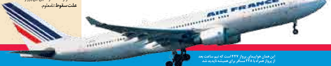
این همان هواپیمای پرواز ۴۴۷ است که نیم ساعت بعد از پرواز همراه با ۲۲۸ مسافر برای همیشه ناپدید شد

هستند که توجه همه را به خود جلب می‌کنند.